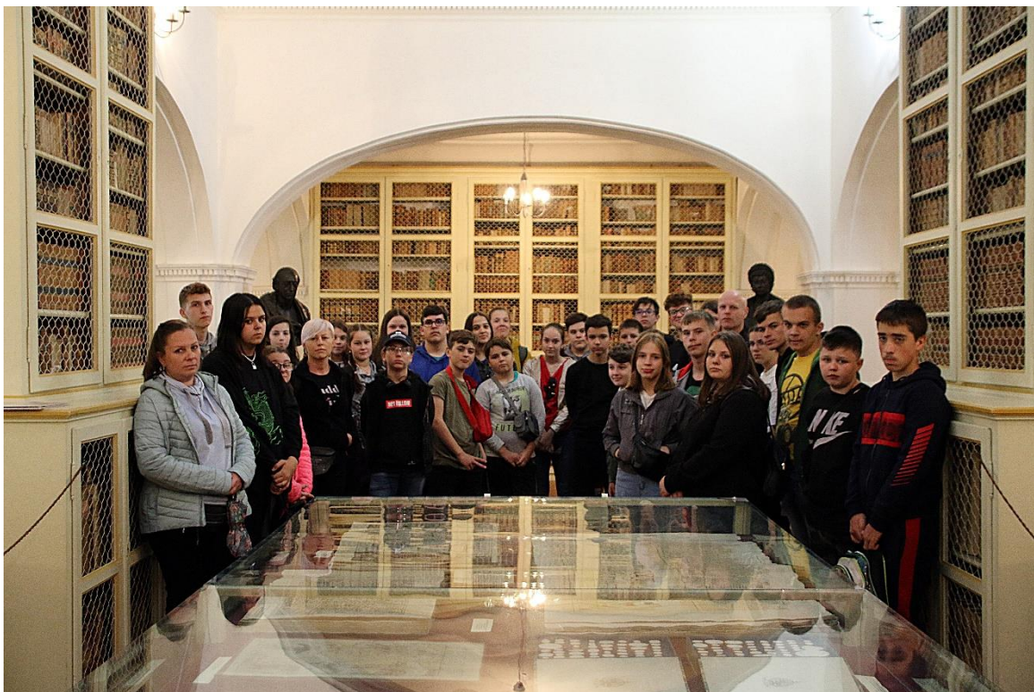
A Teleki Téka megtekintése Marosvásárhelyen