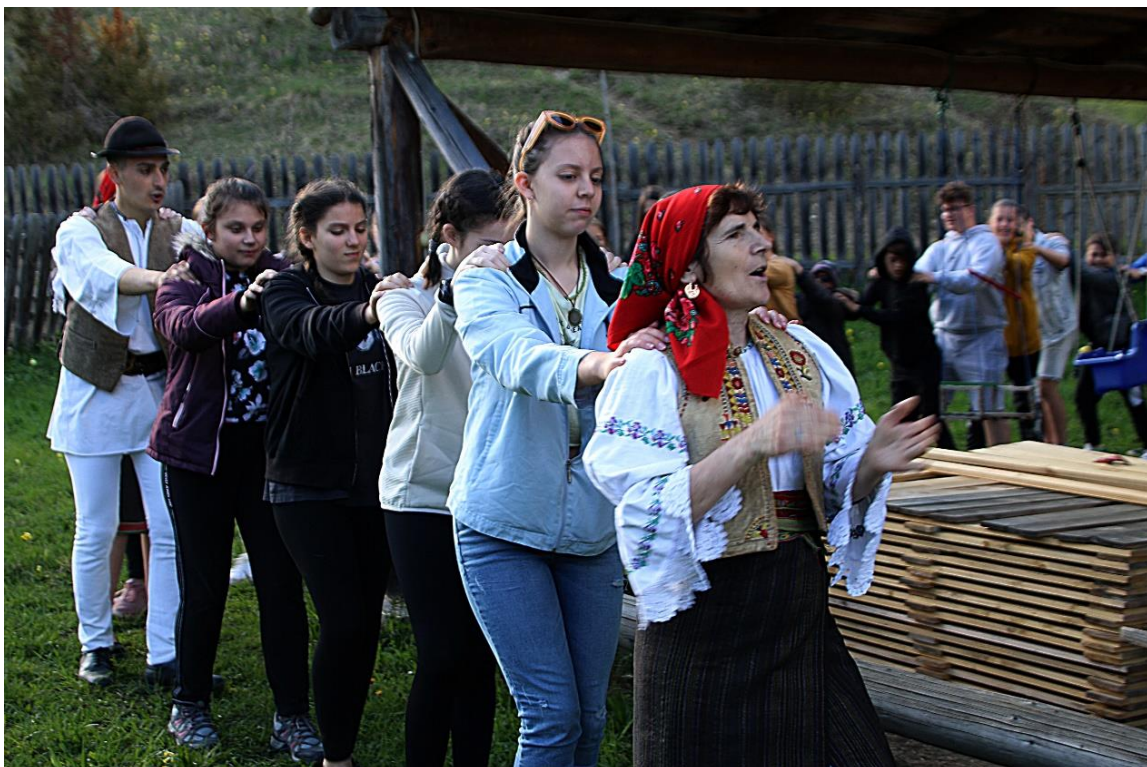
Néptánc bemutató Gyimesközéplokon, Hidegségpatakán