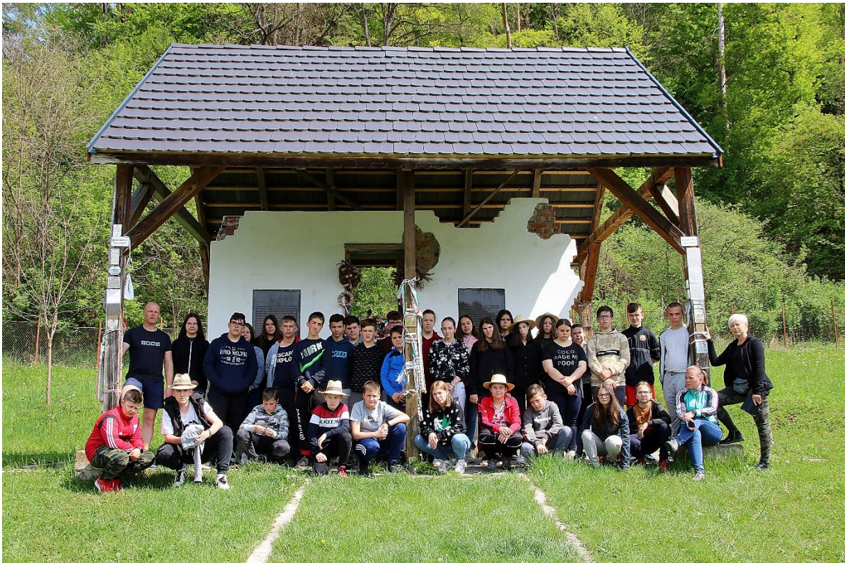
Az elárasztott falu emlékhelyénél Bözödújfalun