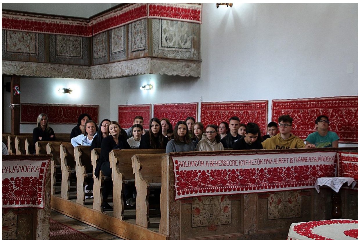
Látogatás a körösfői református templomban