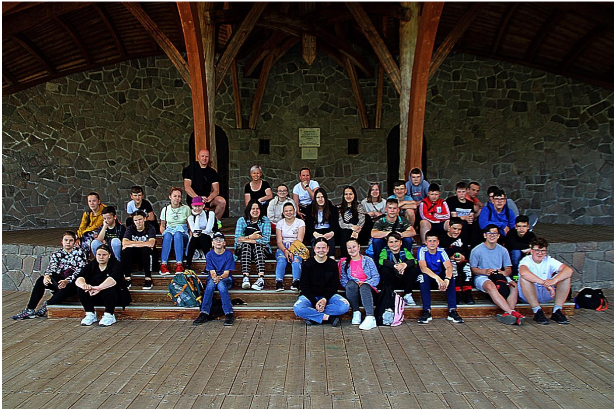
A pünkösdi búcsú helyszínéül szolgáló szabadtéri színpad felkeresése Csíksomlyón