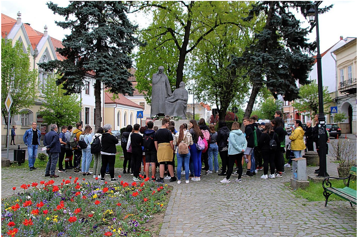
A Bolyaiak szobrának megtekintése Marosvásárhelyen