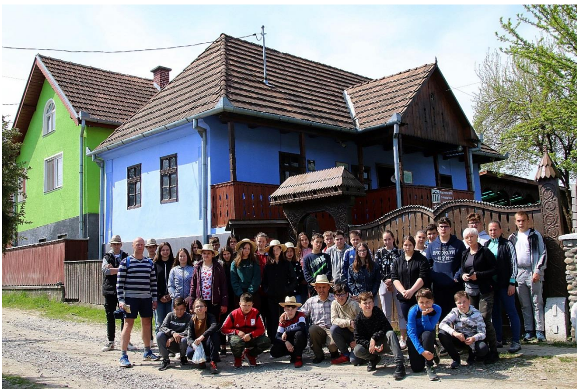
A Szalmakalap Múzeum bejárata előtt Körispatakon