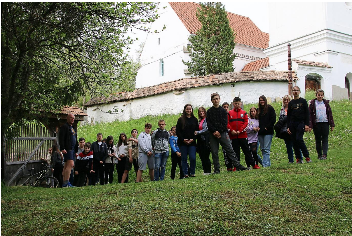
Az unitárius templom meglátogatása Énlakán