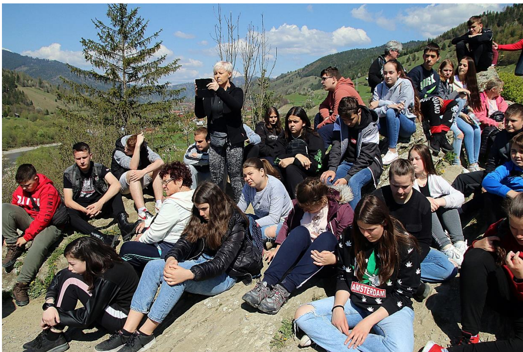
Pihenő a Rákóczi-vár romos falai között Gyimesbükön