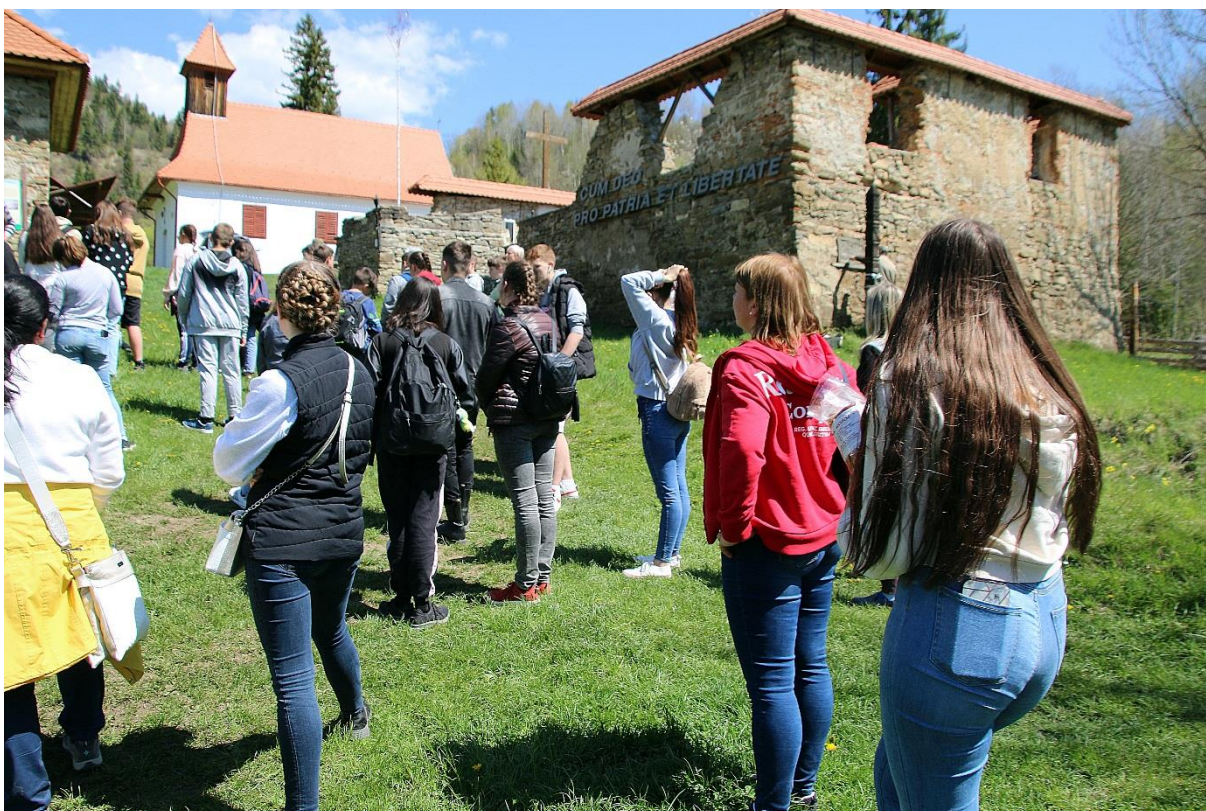
Séta Gyimesbükön, a Kontumáci templomhoz és az első világháborúban elesett magyar katonák emlékhelyéhez