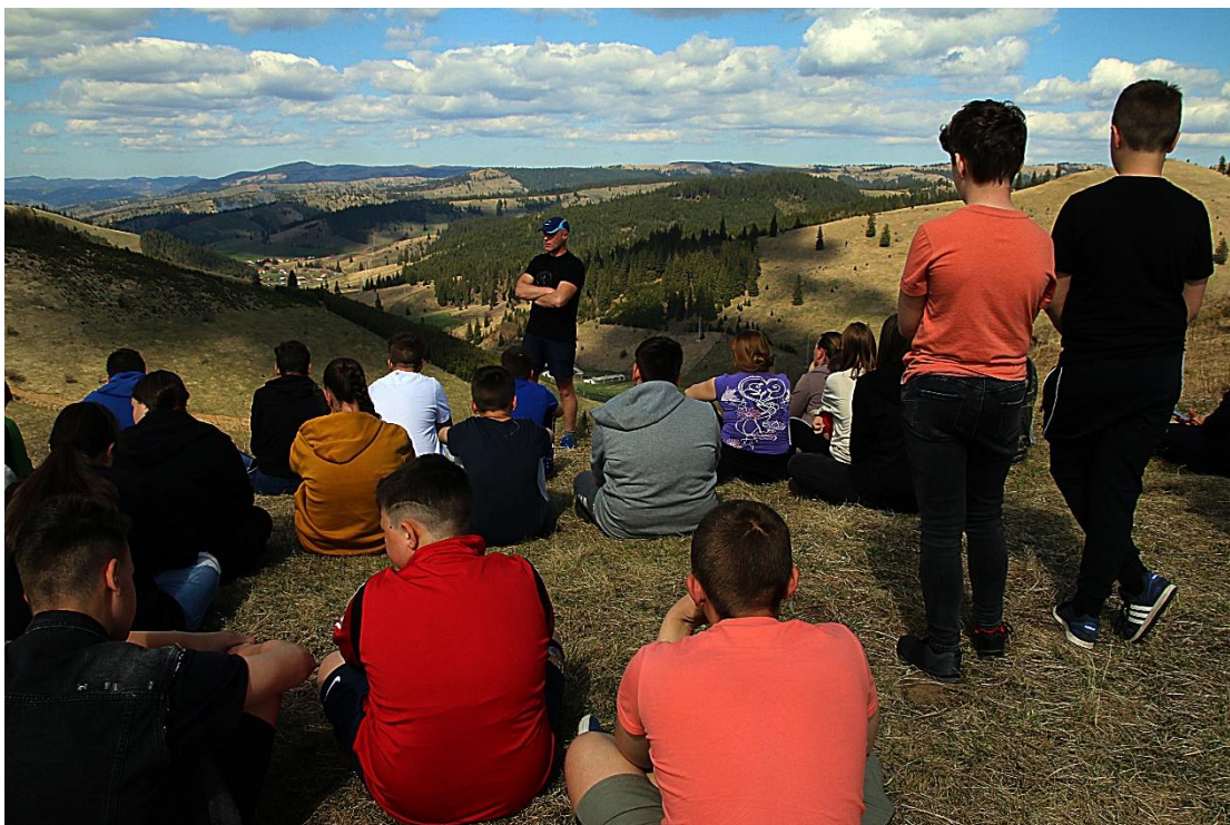
Pihenő a gyimesi csángók világának kapujában, a Fügés-tetőn