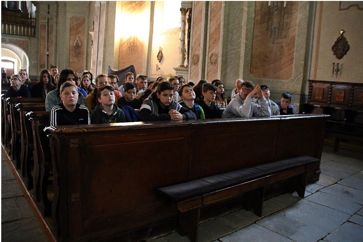
Látogatás a csíksomlyói kegytemplomban