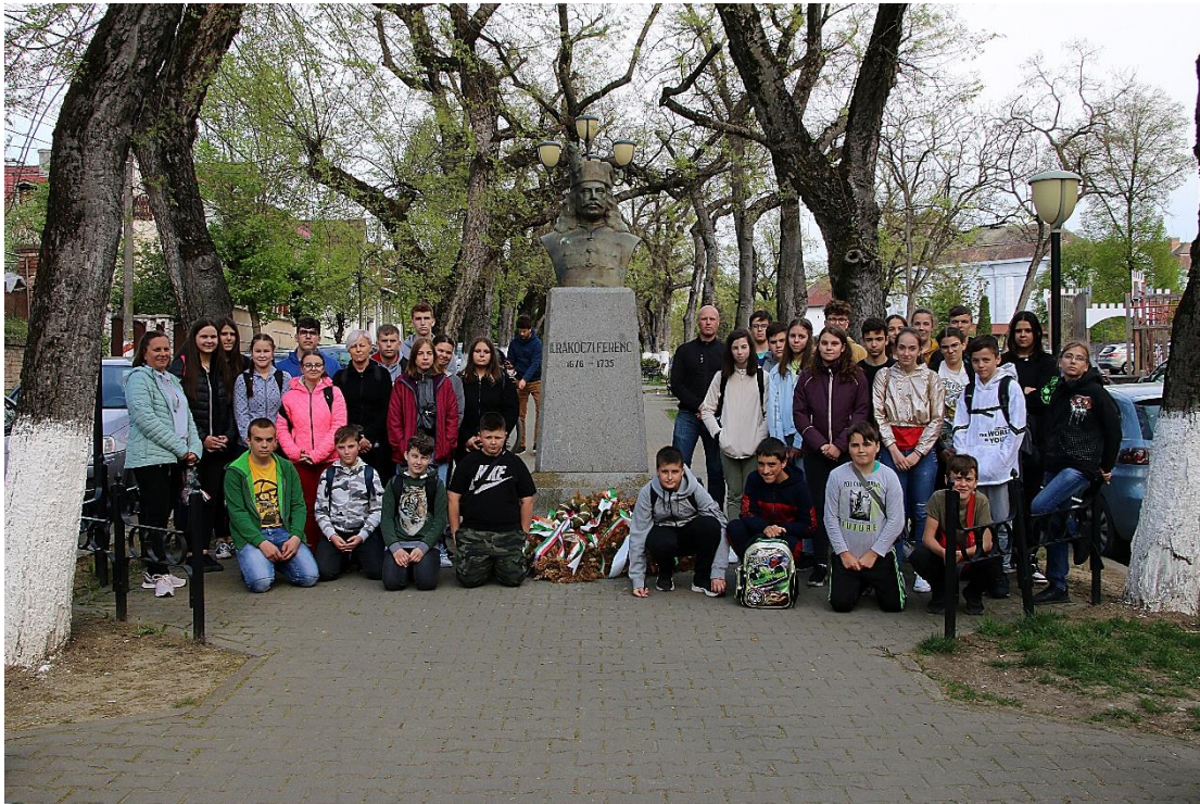
II. Rákóczi Ferenc szobrának megkoszorúzása Marosvásárhelyen