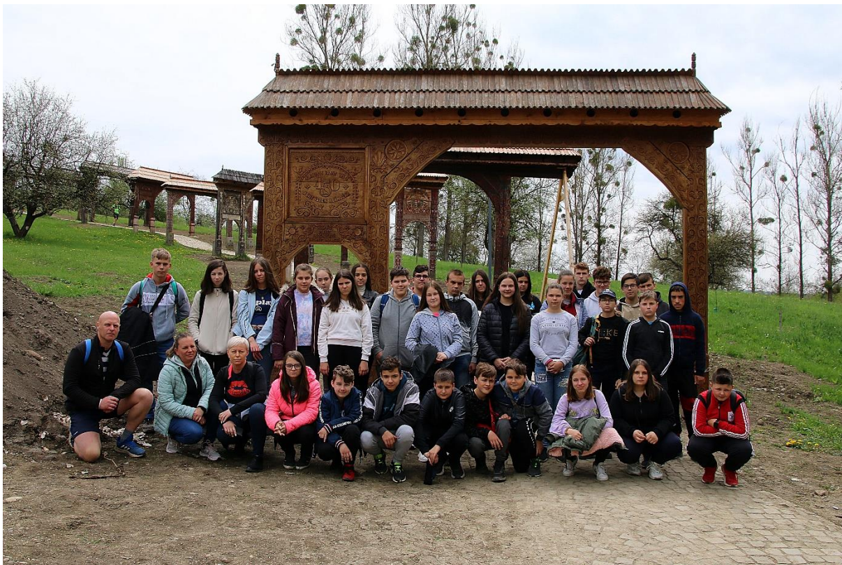
A szabadtéri székelykapu kiállítás megtekintése Szekesfehervar