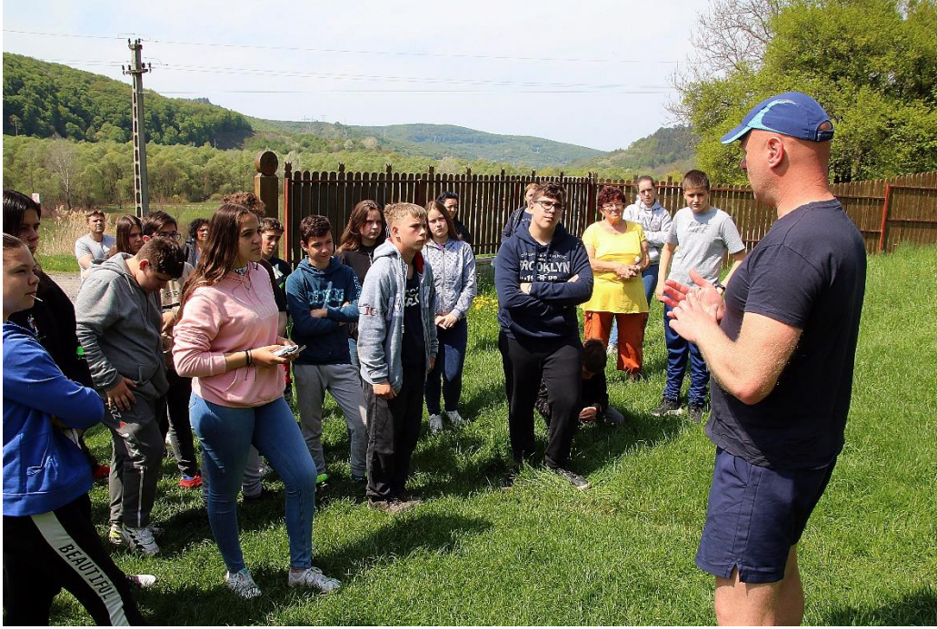
Az elárasztott falu emlékhelyénél Bözödújfalun