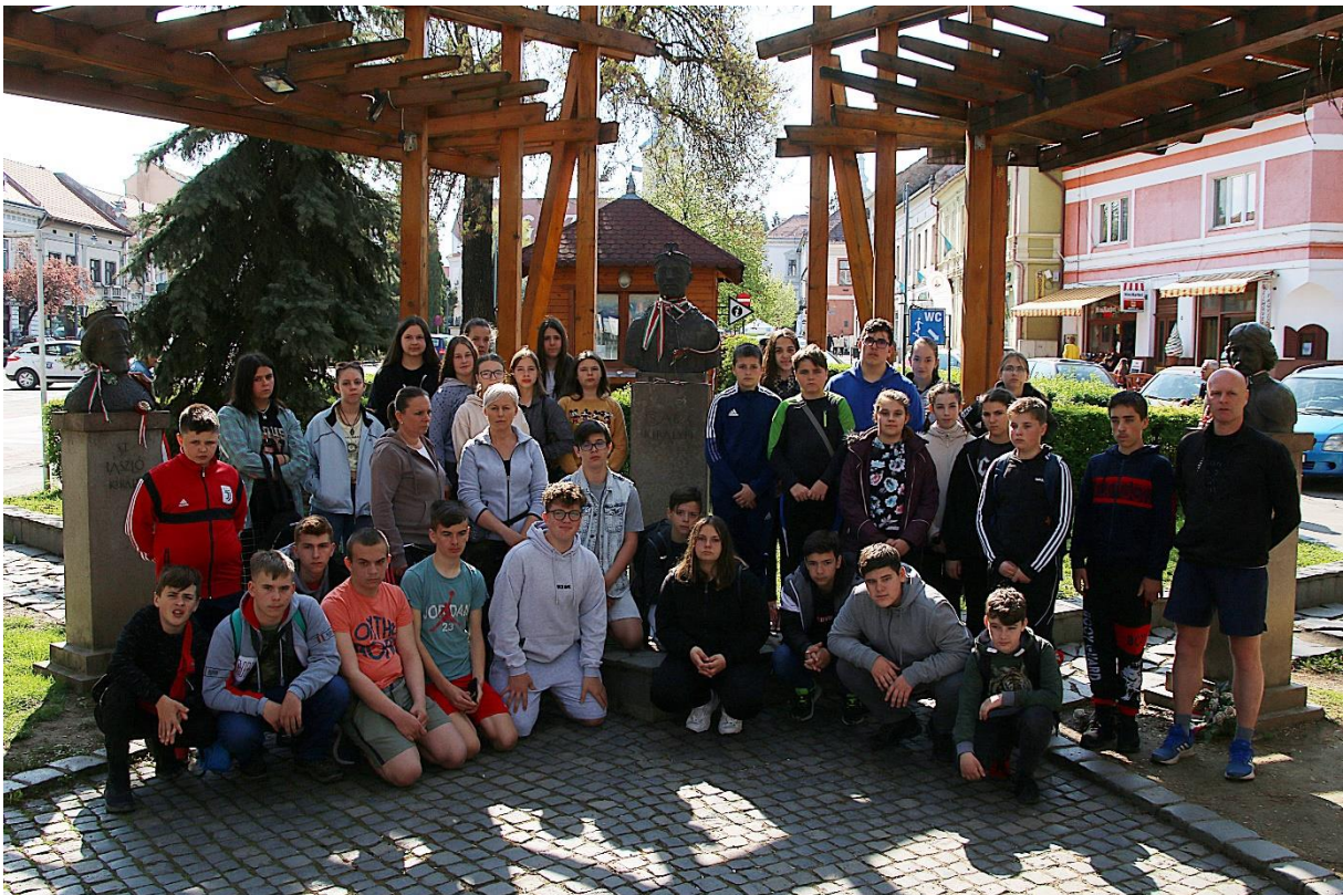
Székelyudvarhelyen az Emlékezés Parkjában, Csaba királyfi szobránál