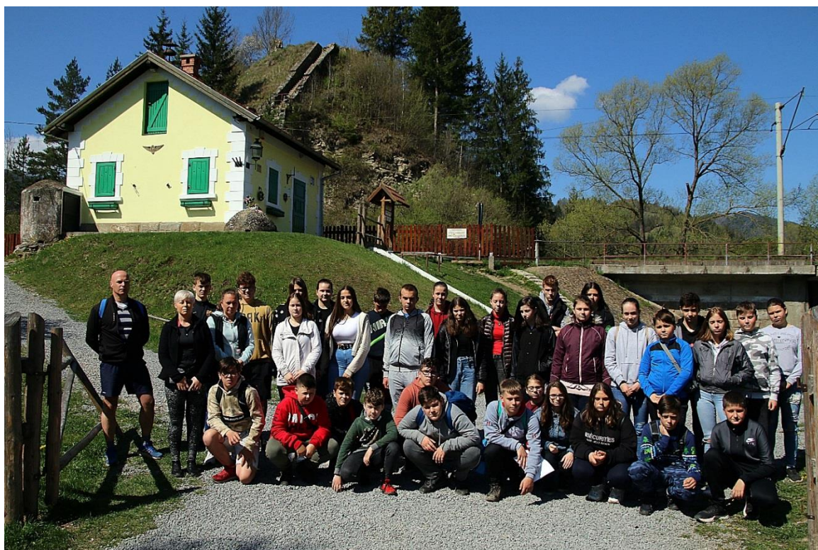
A Magyar Királyi Állam Vasutak által épített őrháznál Gyimesbükkön, ahol a történelmi Magyarország határa húzódott