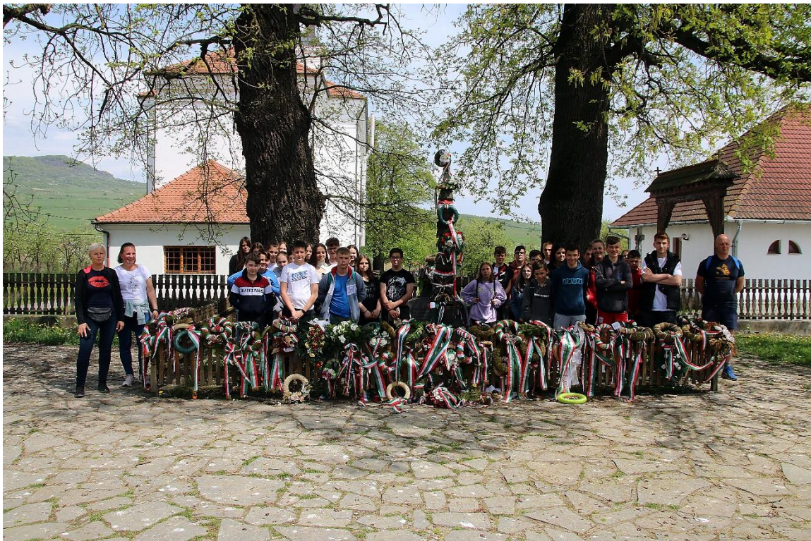
Emlékezés Tamási Áron sírjánál Farkaslakán