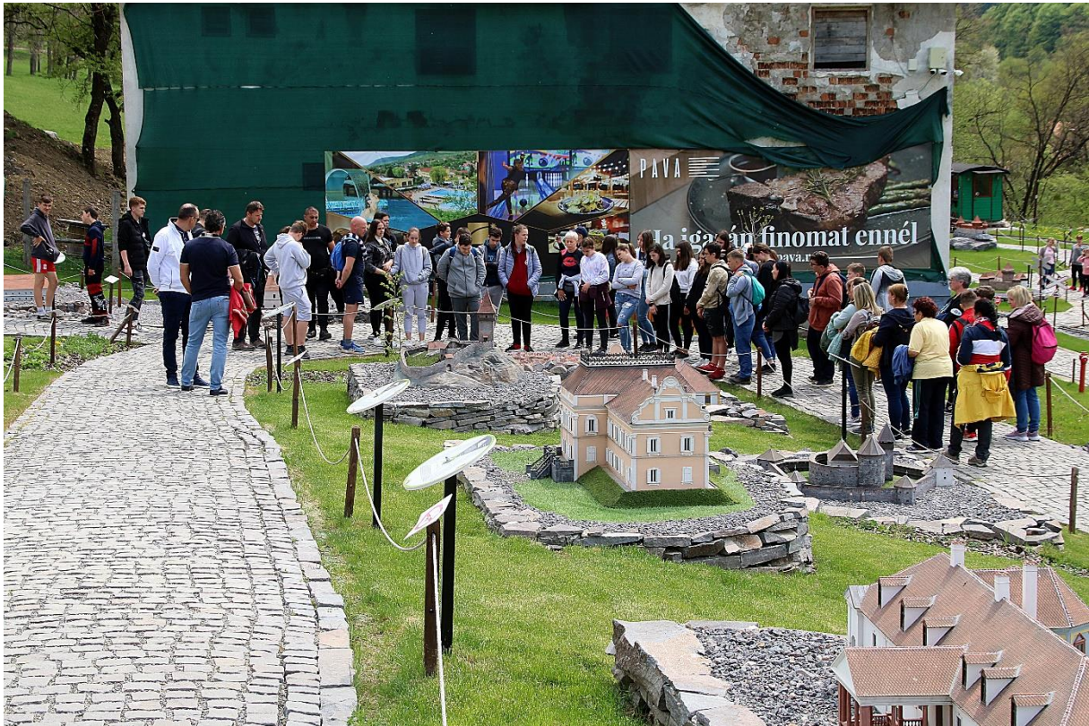
A Mini Erdély Park megtekintése Szejkefürdőn