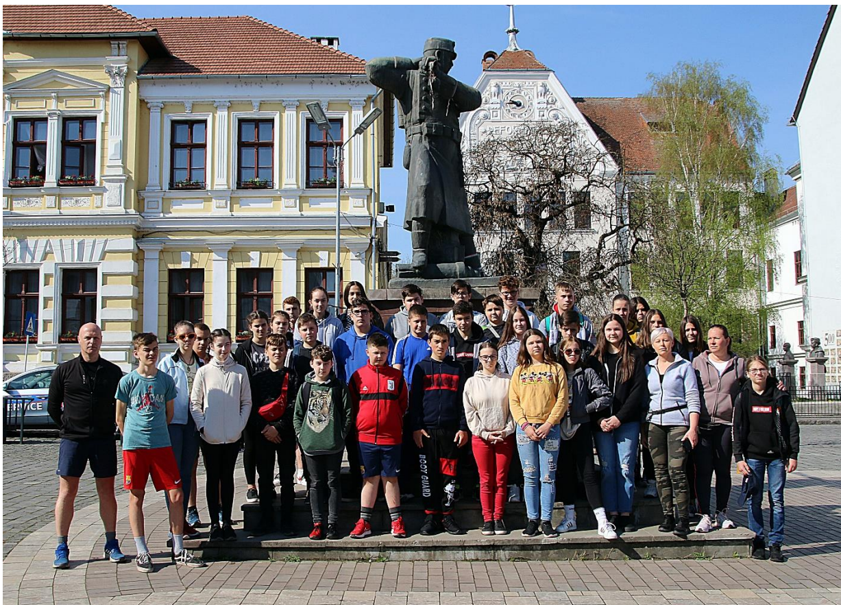
Az első világháborúban elesett magyar katonák emlékművénél, a „Vasszékelynél” Székelyudvarhelyen