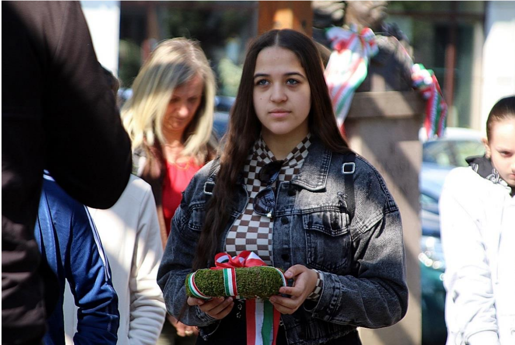
Csaba királyfi szobrának megkoszorúzása Székelyudvarhelyen az Emlékezés Parkjában