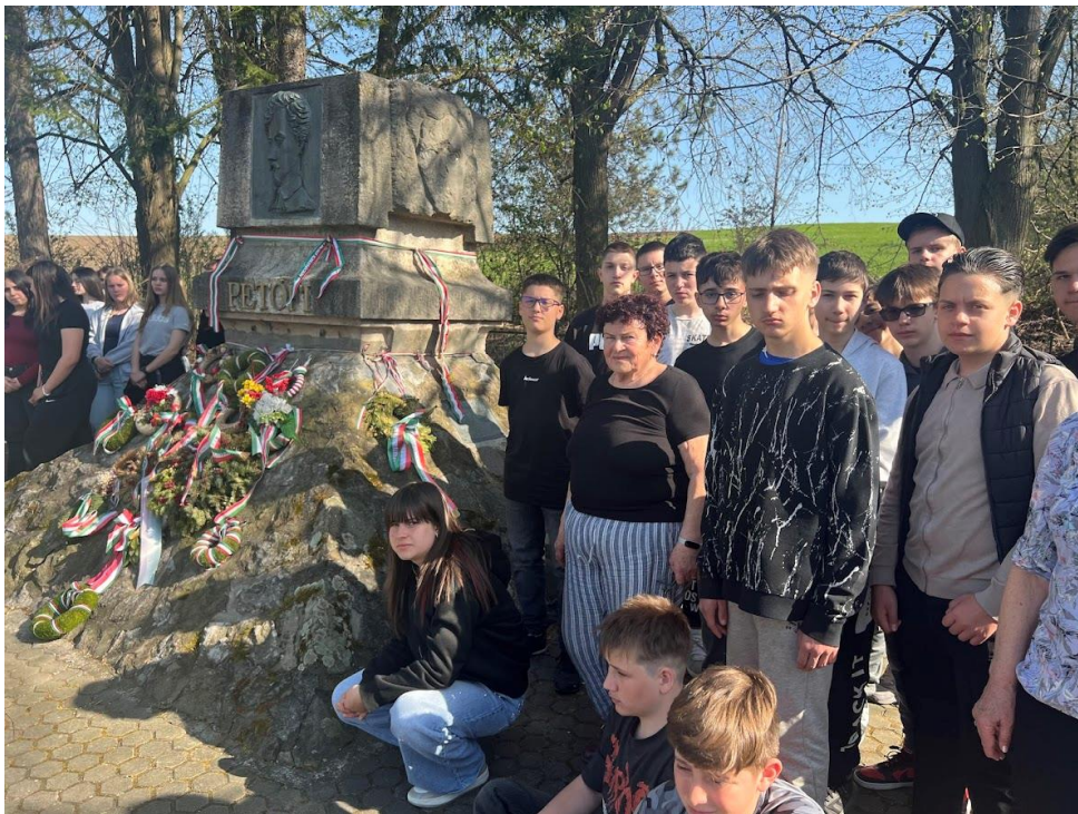
Fehéregyházán az 1849. évi magyar honvédáldozatok sírjának megkoszorúzása