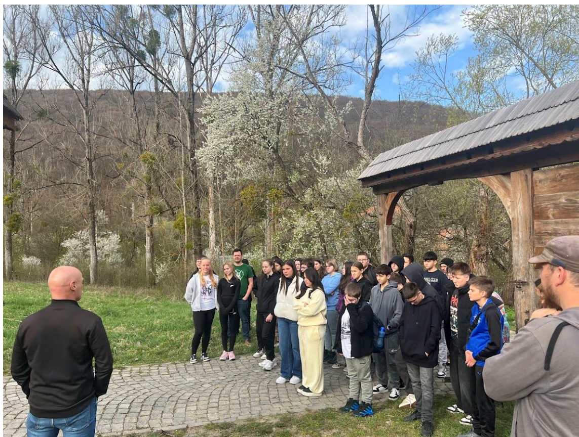
Szejkefürdőn a székelykapu kiállítás megtekintése