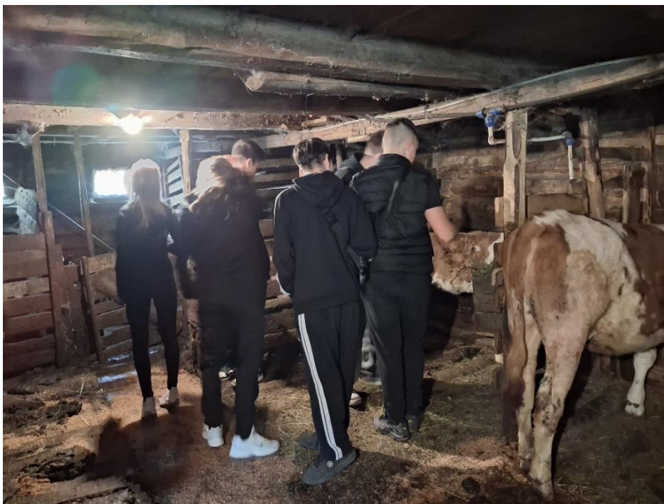
Gyimesközéplokon, Hidegségpatakán mezőgazdasági udvar és istálló megtekintése