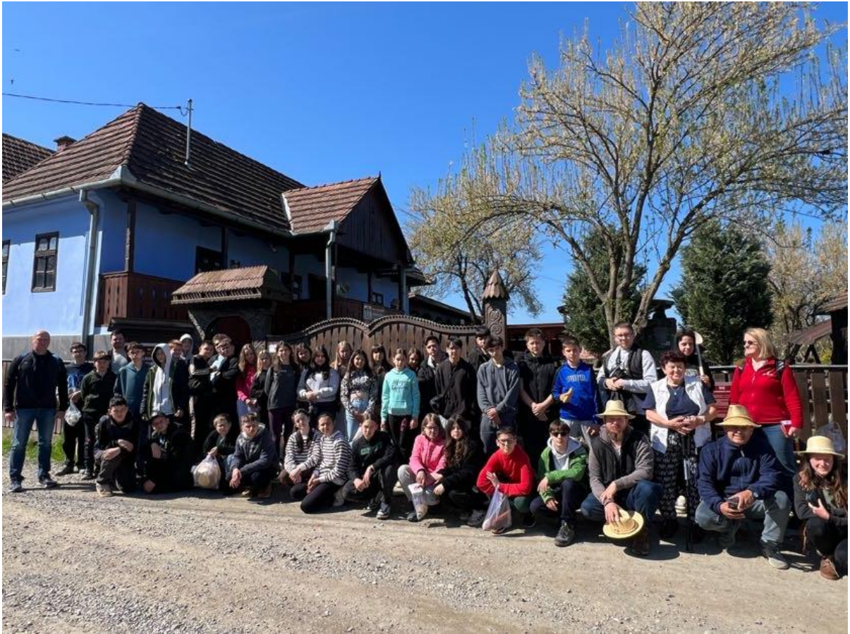
Körispatakon a Szalmakalap Múzeum megtekintése