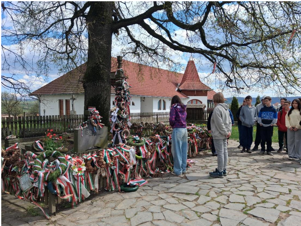
Farkaslakán Tamási Áron sírjának megkoszorúzása