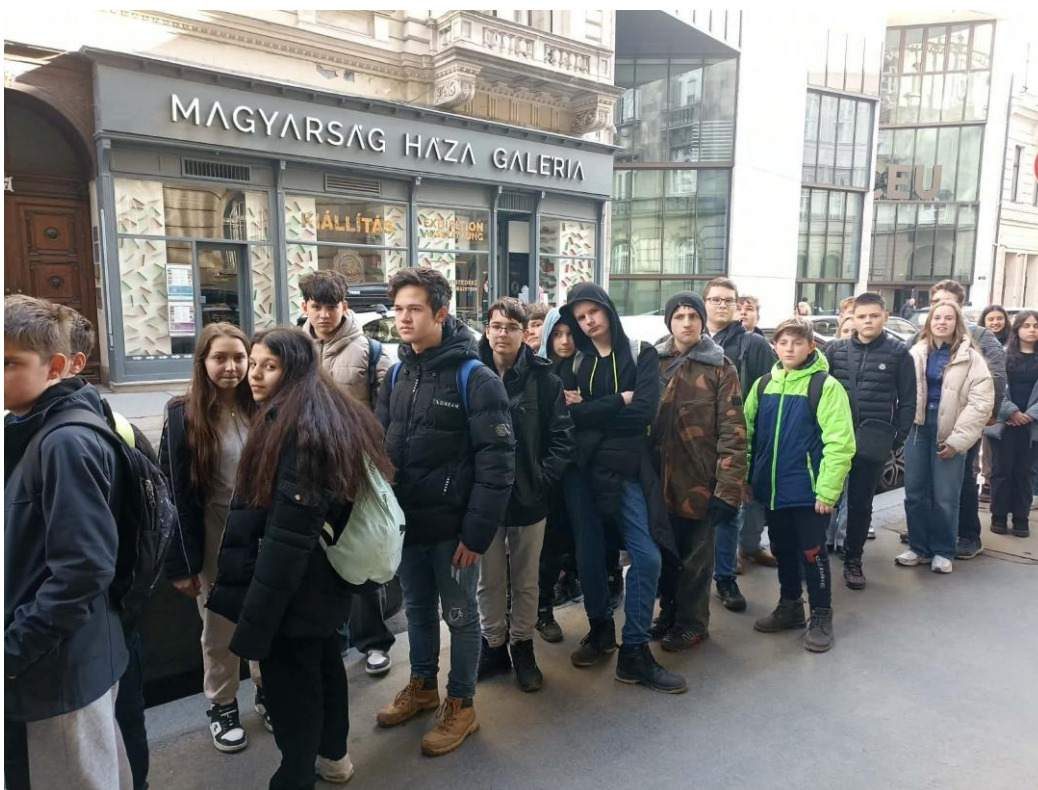
2026. február 13-án részvétel Budapesten a Magyarság Háza intézmény előadásán