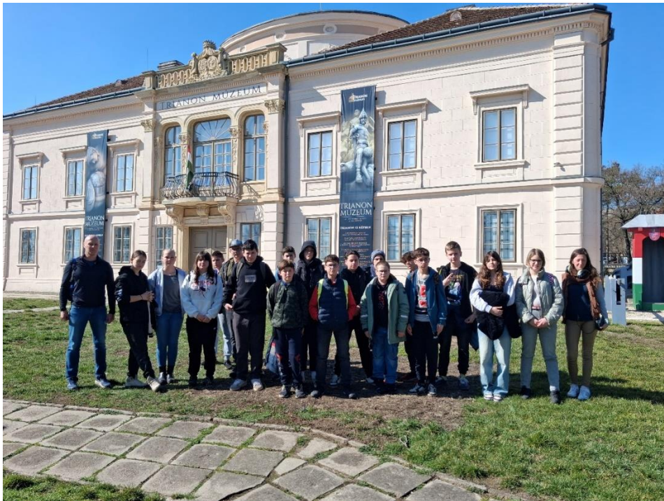
2026. március 7-én Várpalotán a Trianon Múzeum megtekintése