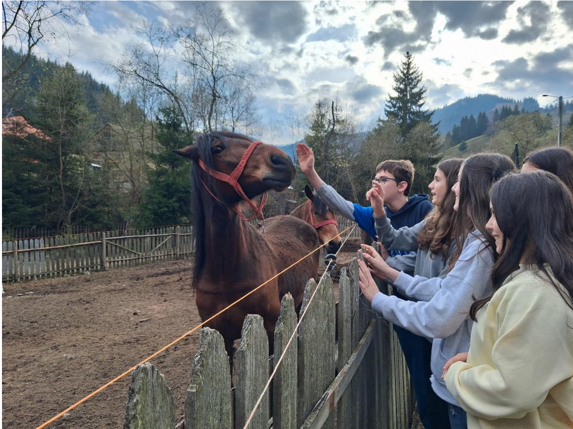
Gyimesközéplokon, Hidegségpatakán mezőgazdasági udvar és istálló megtekintése