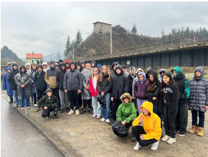
Gyimesbükkön az ezeréves határ emlékeinek megtekintése