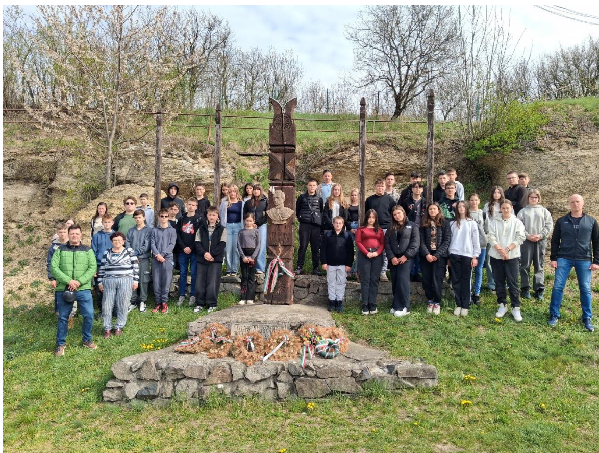
Körösfőn Vasvári Pál kopjafájának megkoszorúzása