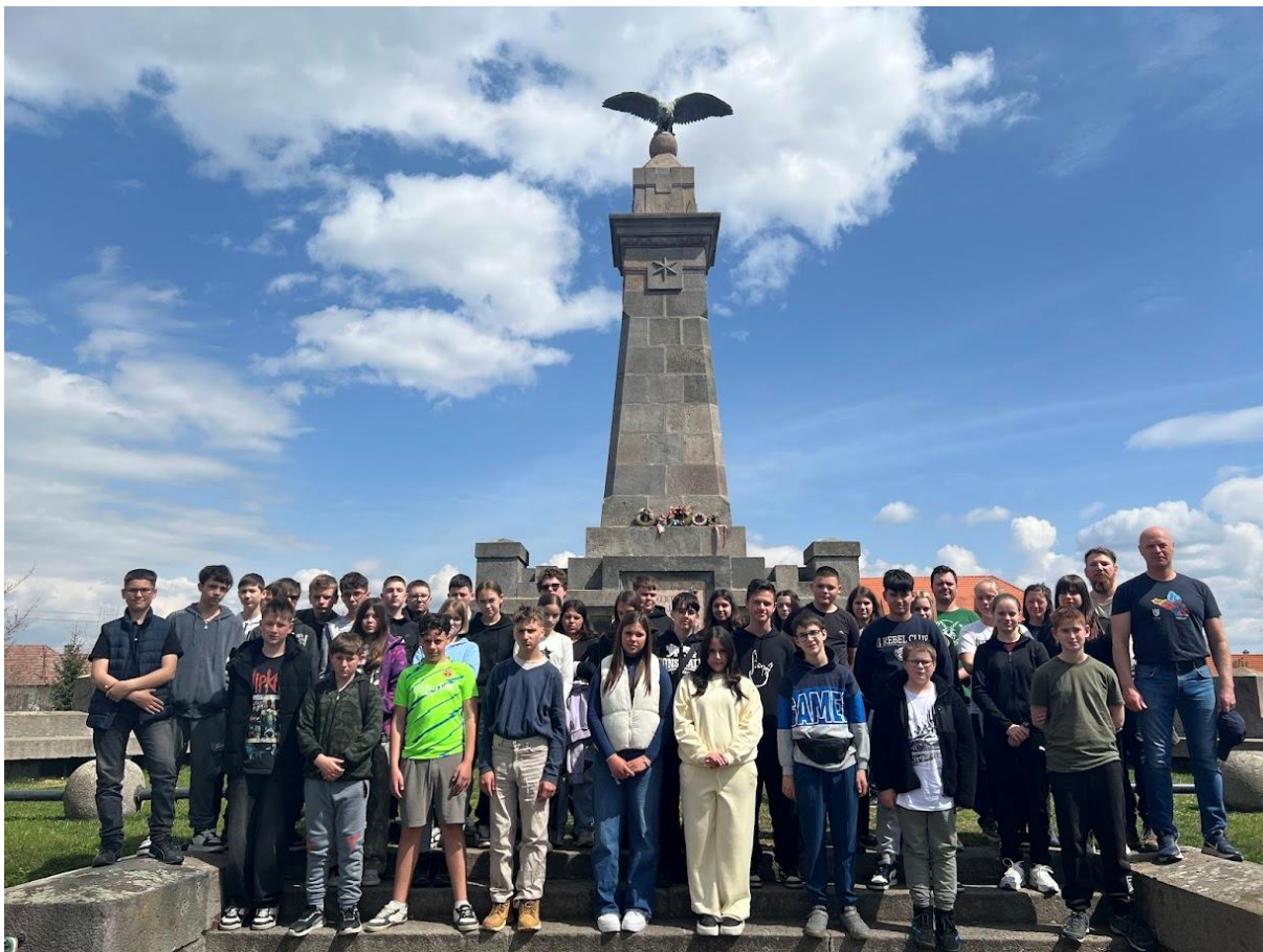
Madéfalván az 1764. évi székely veszedelem emlékművének megkoszorúzása