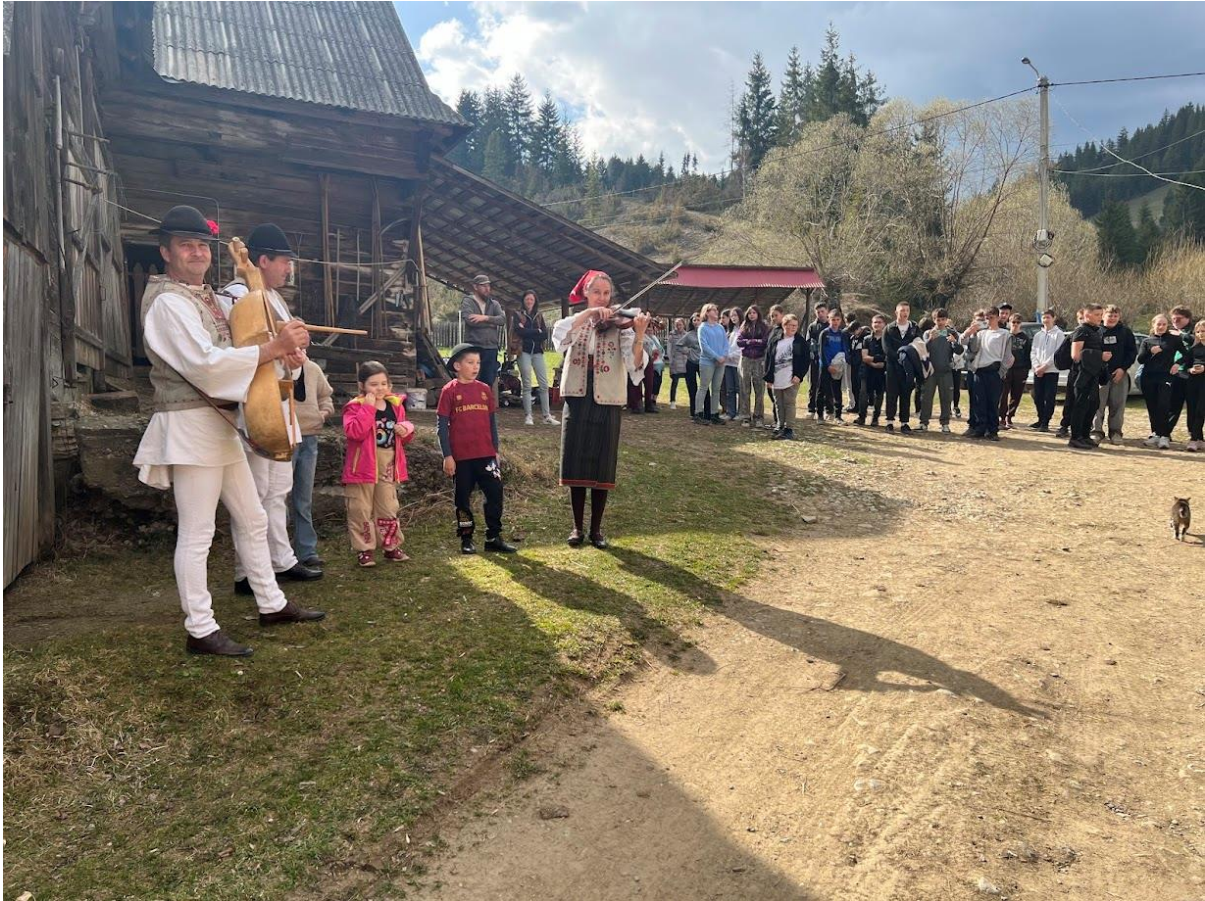
Gyimesközéplokon, Hidegségpatakán néptánc és viselet bemutató