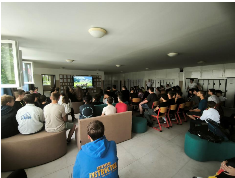
2026. június 4-én Határtalanul témanap keretében az erdélyi kirándulásról készült kisfilm levetítése