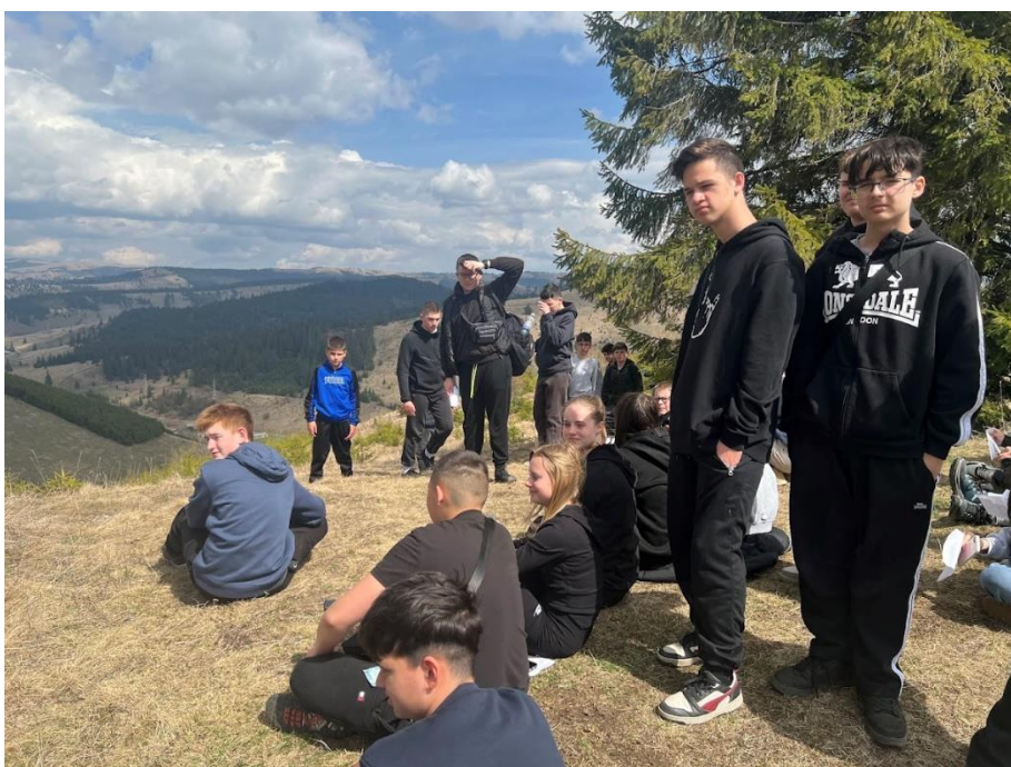
A Fügés-tetőn a Gyimesi táj szépségének megcsodálása