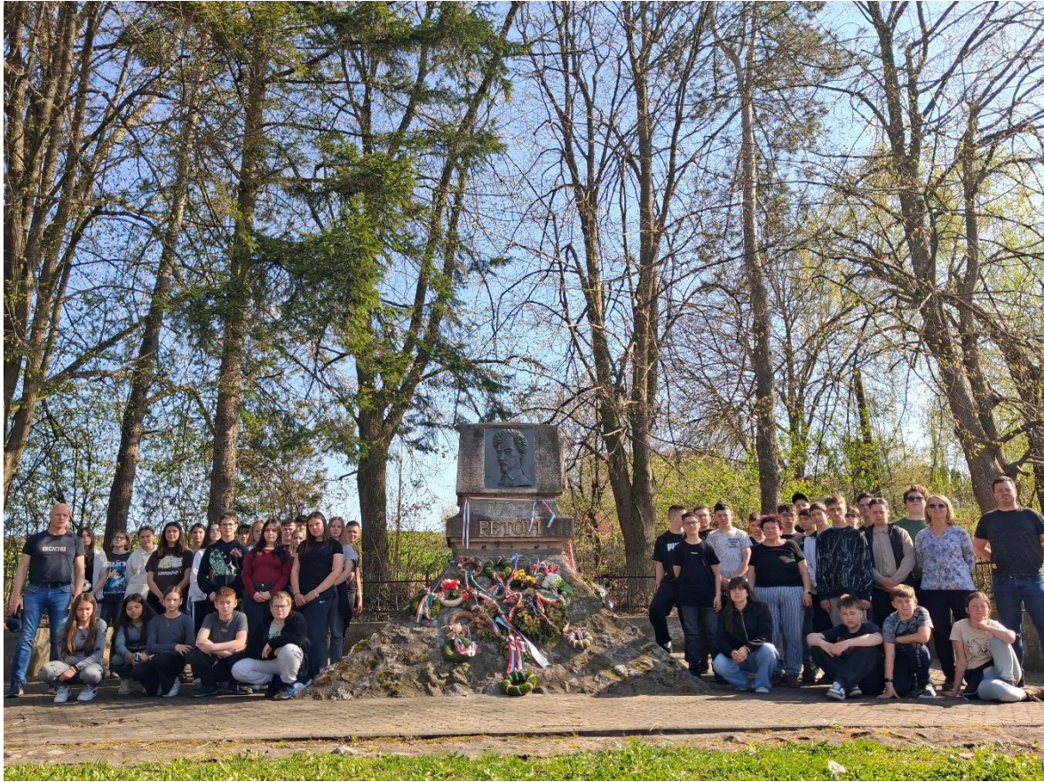
Fehéregyházán az 1849. évi magyar honvédáldozatok sírjának megkoszorúzása