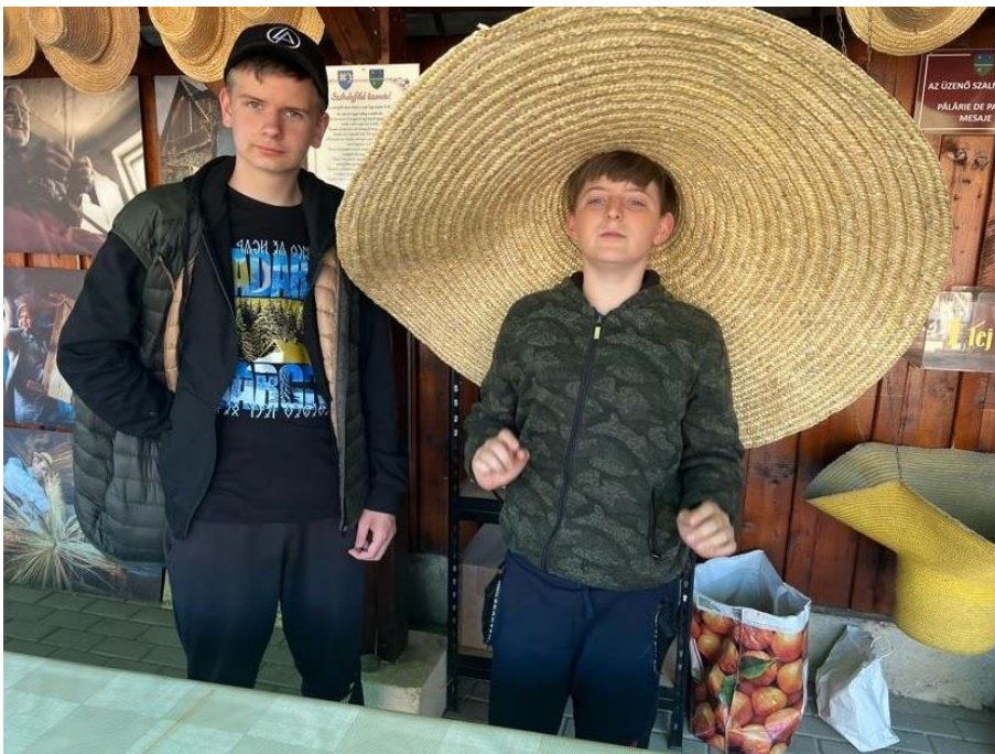
Körispatakon a Szalmakalap Múzeum megtekintése