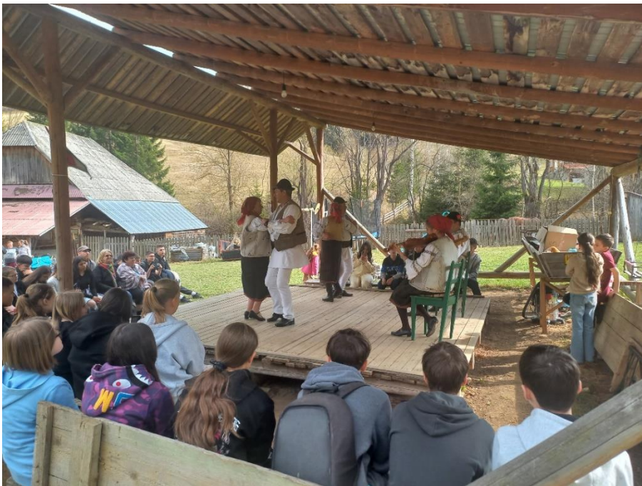
Gyimesközéplokon, Hidegségpatakán néptánc és viselet bemutató