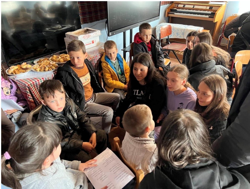
Klézsén, a Szeret-Klézse Alapítvány székházában találkozás a délutáni fakultatív magyar oktatásban résztvevő moldvai csángó gyerekekkel