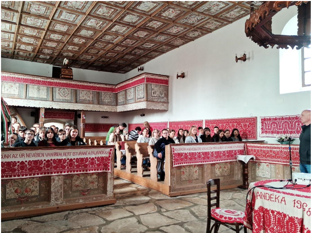
Körösfőn a református templom megtekintése