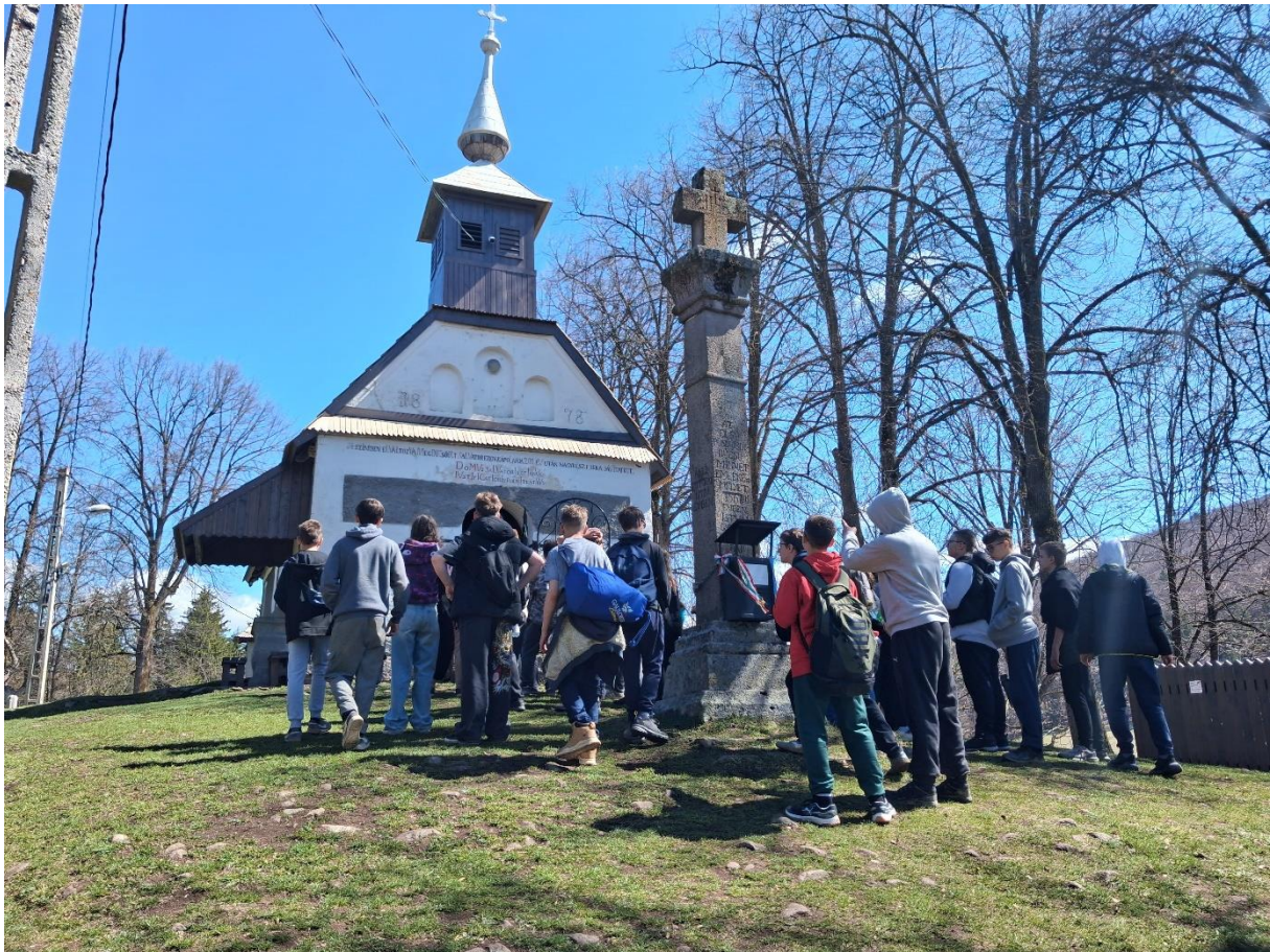
Csíksomlyón a Salvator-kápolna megtekintése