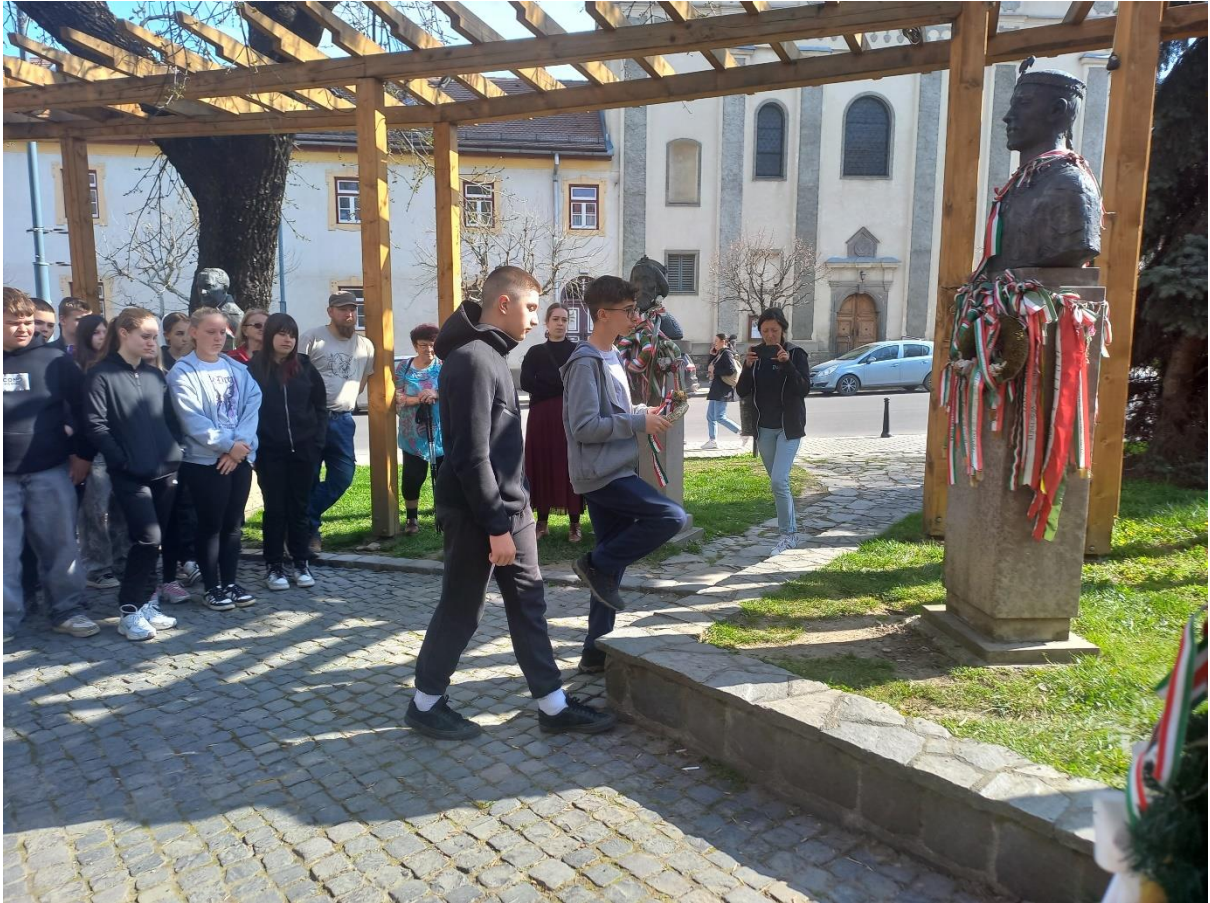
Székelyudvarhelyen Csaba királyfi szobrának megkoszorúzása