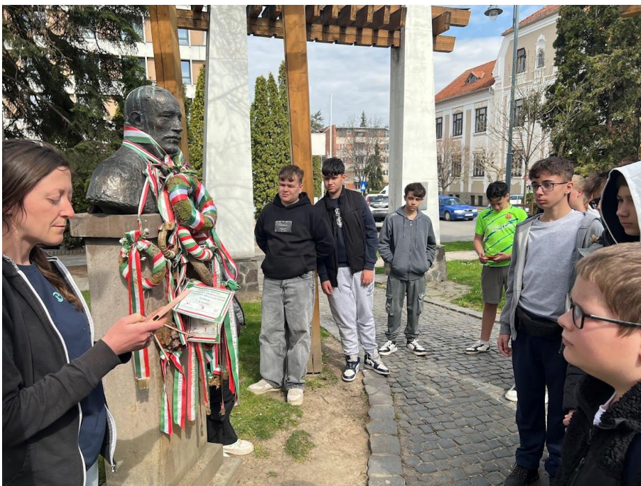
Székelyudvarhelyen Wass Albert írói munkásságának méltatása