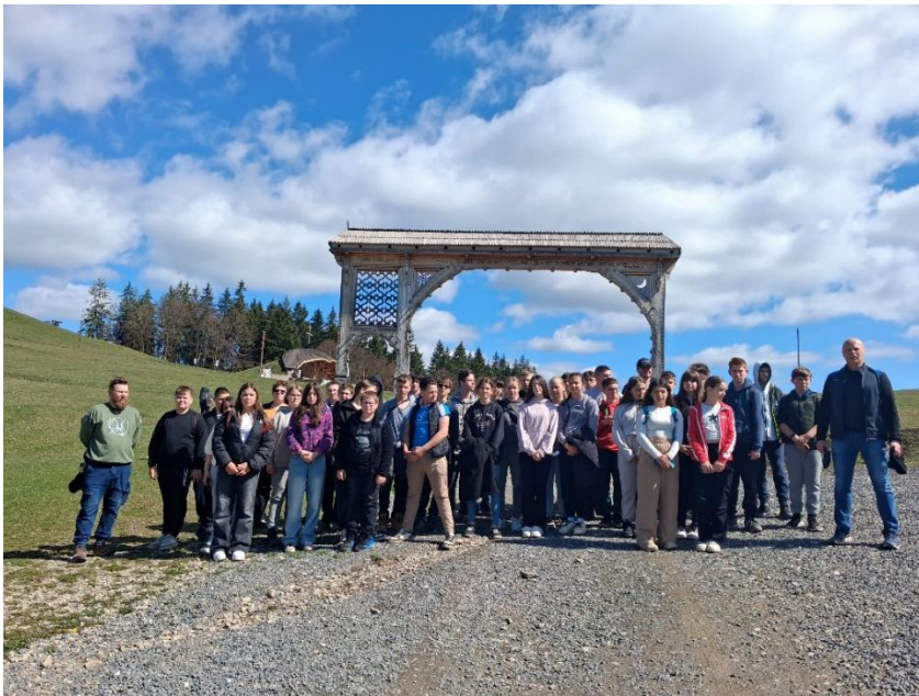
Csíkssomlyón a pünkösdi búcsú helyszínét adó Nyeregben