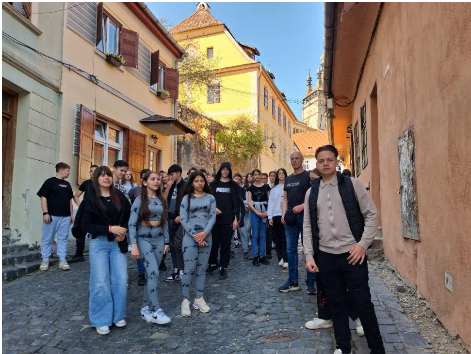
Segesváron séta a szász óvárosban