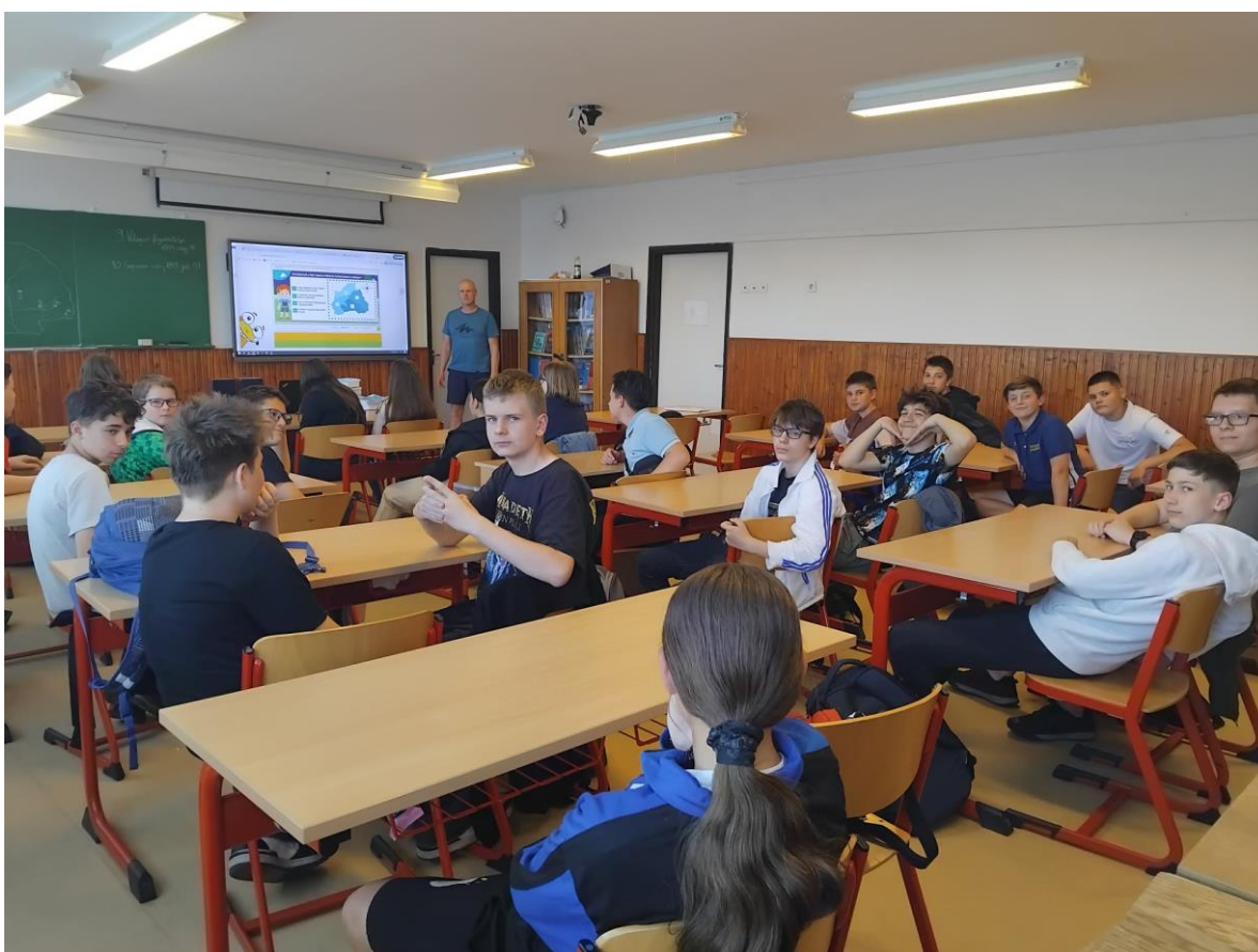
Barangoló digitális tartalomtár használata az előkészítő foglalkozáson