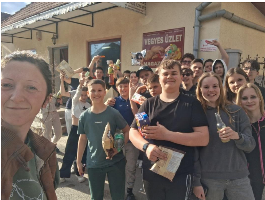
Körispatakon örömteli vásárlás közben